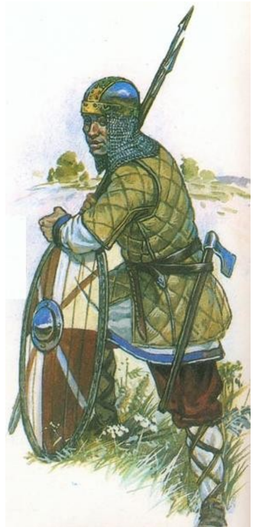
Finne oder Slawe